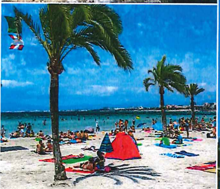
Palmen, Sand, Meer und Urlauber: Der Strand von S'Arenal an der Bucht von Palma ist weltberühmt