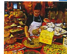
Eine Schlemmeroase mit Inseleköstlichkeiten ist die Markthalle an der Plaça de l'Olivar

schönsten Strand der Insel an, Es Trenc . Er erstreckt sich über zweieinhalb Kilometer entlang einer geschützten und daher unbeeauteten Dünenlandschaft. Leider ist das kein Geheimtipp mehr und viele haben dieses Ziel im Visier.