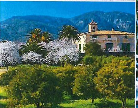
Der Ortsteil von Palma, Es Sencar de la Real, ist eine grüne Oase mit im Frühjahr blühenden Mandel- und Orangenbäumen und hat auch Ferienunterkünfte

Der Sänger Jay Alexander vor der Kulisse von Palmas Jachthafen und der Kathedrale La Seu. Da kann man nur feststellen: „Schön ist die Welt“ und genau so heißt auch sein neues Album