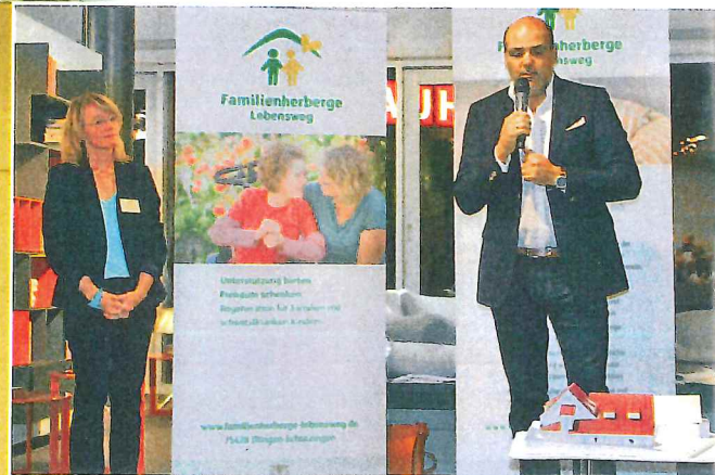
Der Musiker krempelt als Botschafter der „Familienherberge Lebensweg“ die Ärmel hoch. So präsentierte er jüngst das neue Erholungsprojekt für kranke Kinder und deren Familien