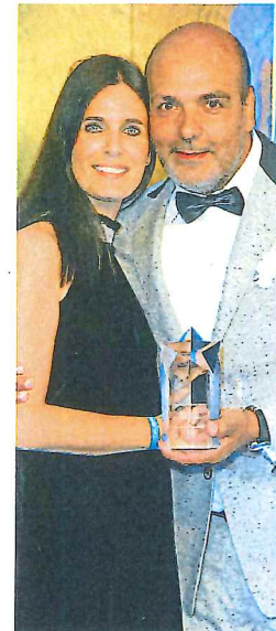
Ganz Gentleman teilt Jay den Alcatel-Fanpreis mit seiner bezaubernden Frau